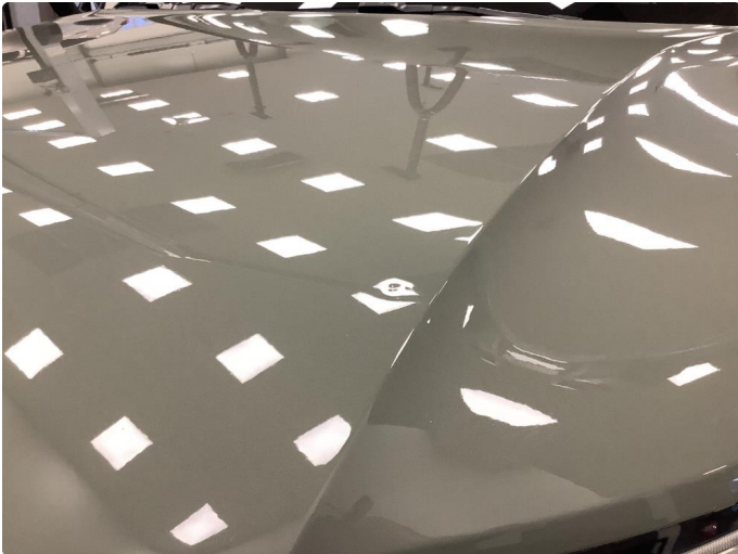
1.1 Liten steinsprutbulk på panser