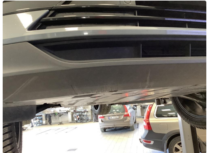
1.2 Små skrubbskader underkant