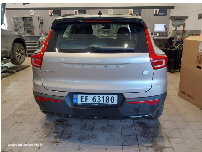
Galaxy Tab Active4 Pro 5G