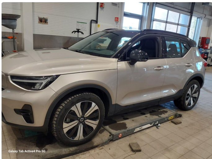
Galaxy Tab Active4 Pro 5G