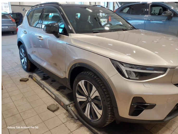
Galaxy Tab Active4 Pro 5G