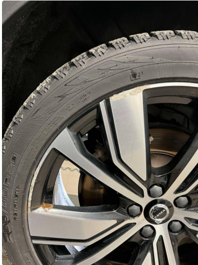
1.1 Kantkjørt felg Diamond Cut