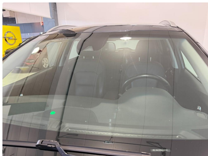
1.2 Noen få små steinsprut på frontrute.