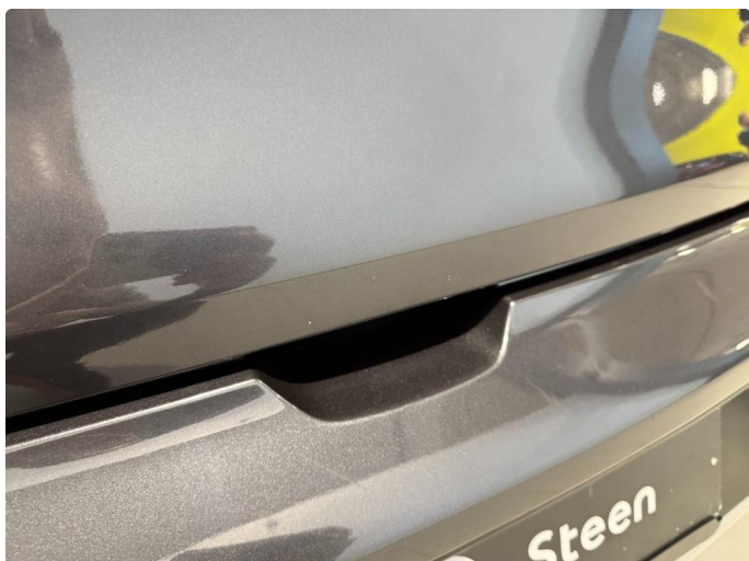
1.1 Noen småriper ved håndtak til bakluke