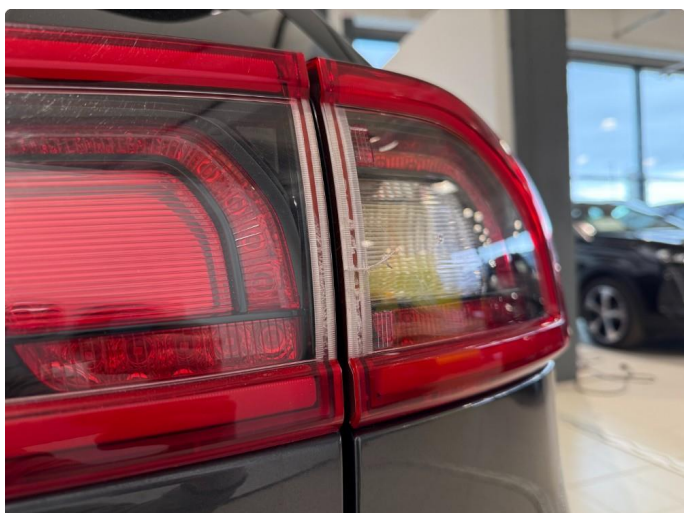
2.1 Liten sprekk og krakelering i begge baklykter