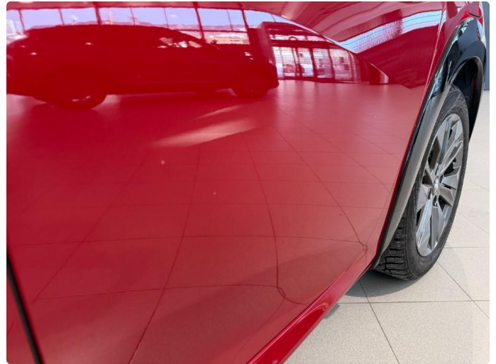
1.2 Noen steinsprut på venstre bakdør