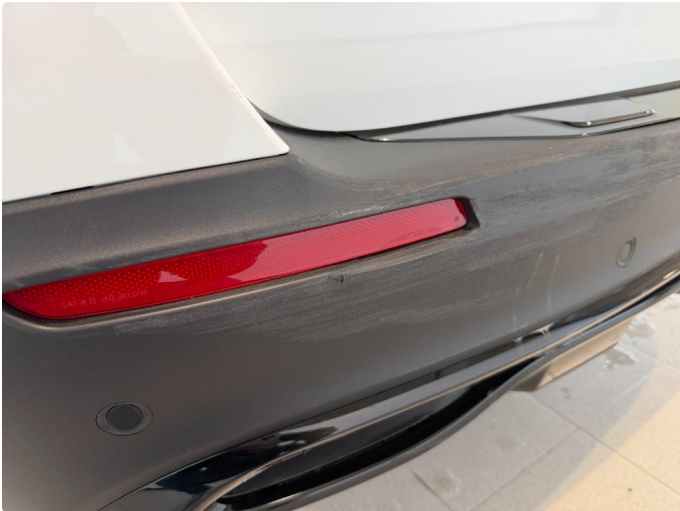
1.1 Riper på plastikk bakfanger