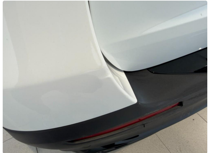
1.2 Liten parkeringsbulk på bakfanger