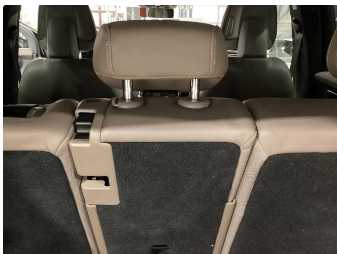
2.1 Liten skade seterygg