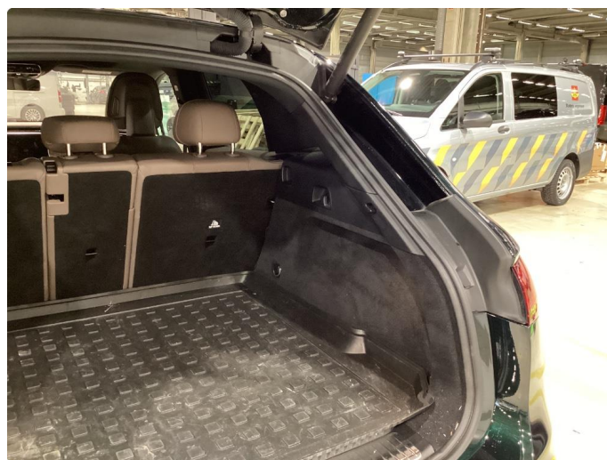
2.2 Liten ripe