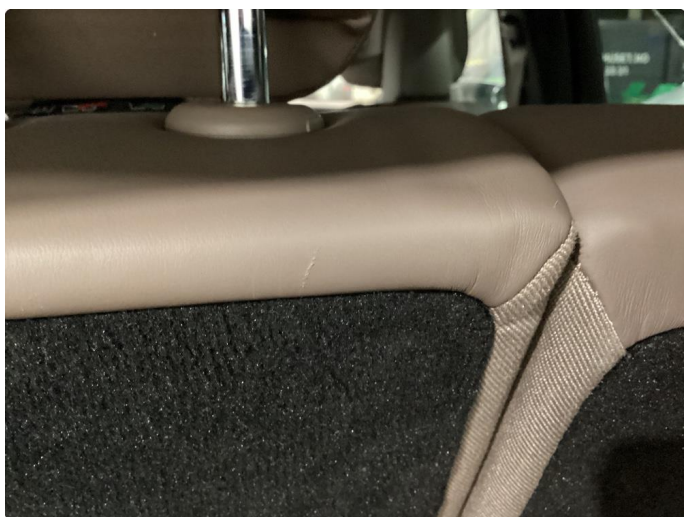
2.1 Liten skade seterygg