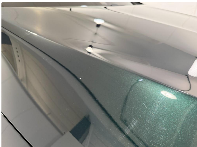
1.1 Steinsprut på panser