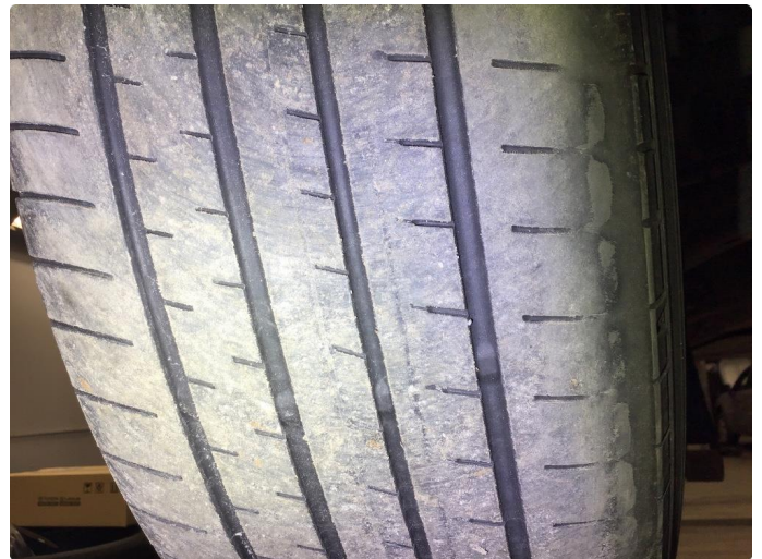
1.2 Skiftet 2 sommerhjul