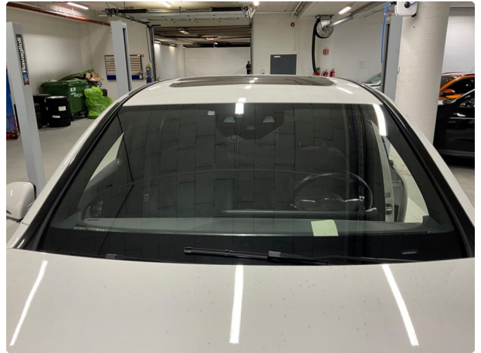
1.1 Liten steinsprutskade nede frontrute. Denne er reparert.