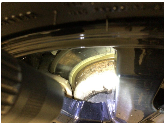
1.1 Øvrige feil