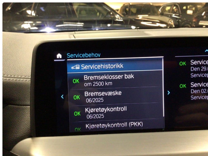
1.1 Øvrige feil