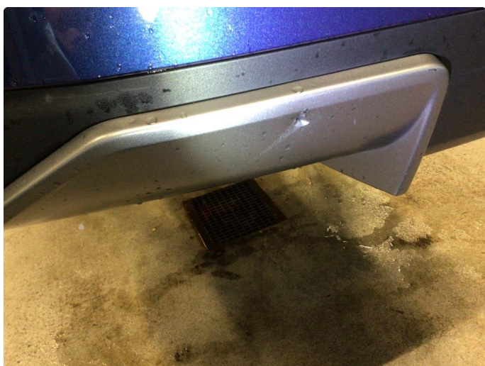
1.2 Øvrige feil