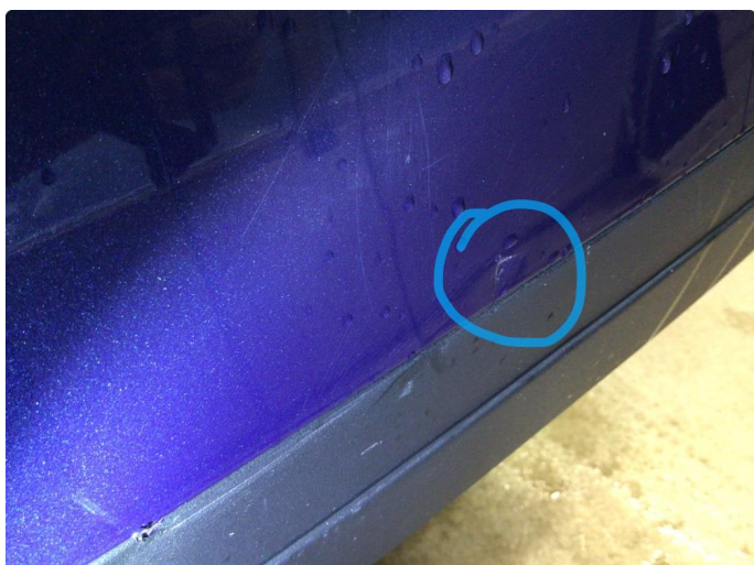
1.2 Øvrige feil