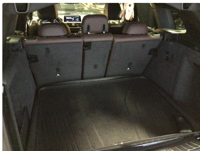
1.3 Øvrige feil