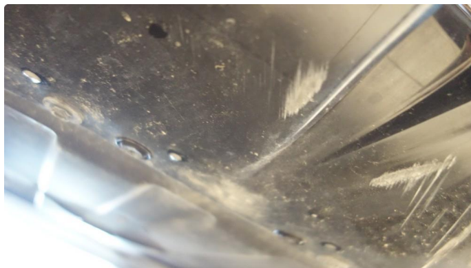
1.3 Skrubbskader underkant - 11.06.2026 EK - Små skrubbskader, men ingen defekt merker.