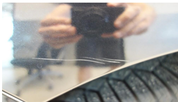
1.1 Generelt mye riper - 11.06.2026 EK - Utbedret med lakkrens