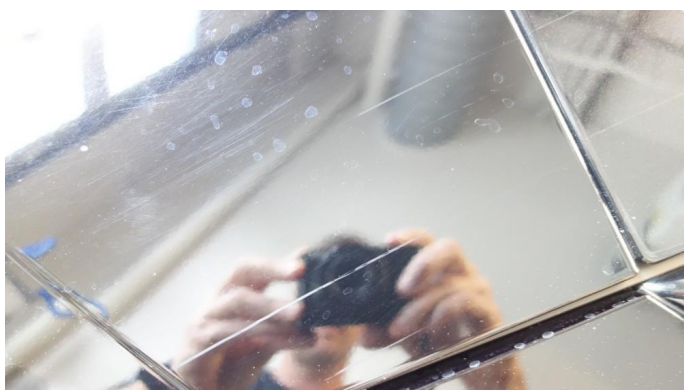
1.1 Generelt mye riper - 11.06.2026 EK - Utbedret med lakkrens