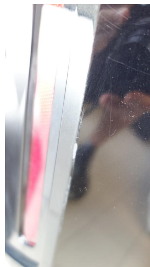
1.2 Skade - 11.06.2026 EK - Utbedret med lakkrens, små riper igjen