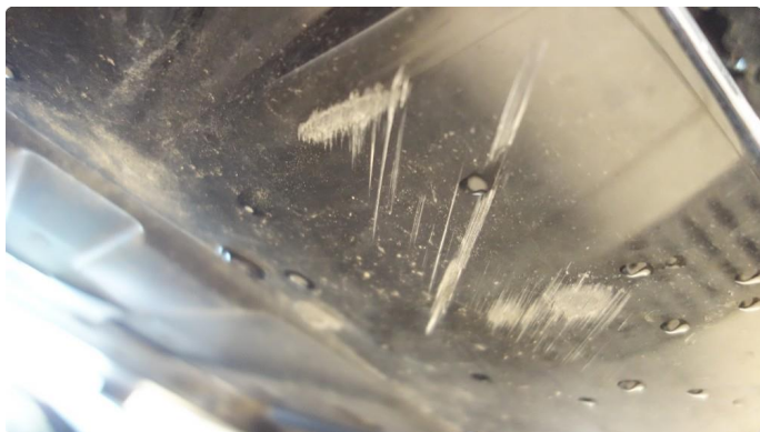
1.3 Skrubbskader underkant - 11.06.2026 EK - Små skrubbskader, men ingen defekt merker.