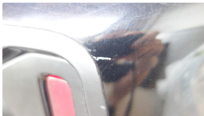
1.2 Skade - 11.06.2026 EK - Utbedret med lakkrens, små riper igjen