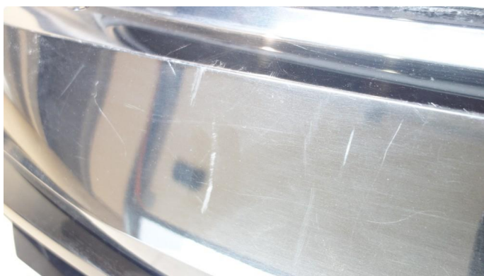
1.2 Skade - 11.06.2026 EK - Utbedret med lakkrens, små riper igjen