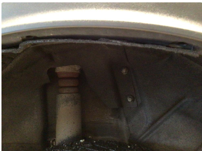
1.1 Skjermutbygger løs