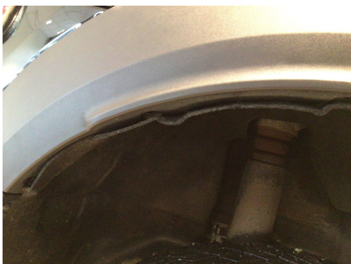
1.1 Skjermutbygger løs