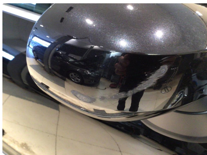
1.2 Speilhus skadet