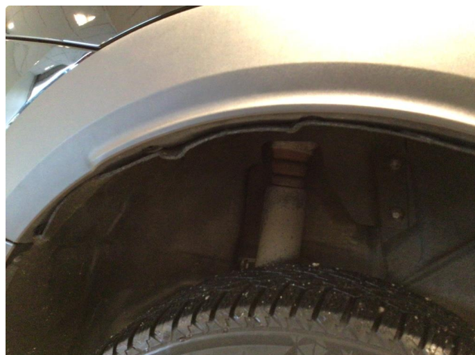
1.1 Skjermutbygger løs