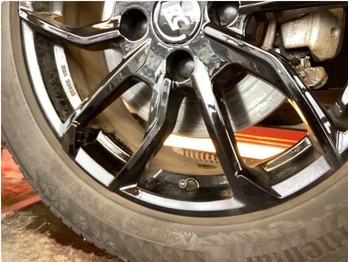
1.1 Riper på felg