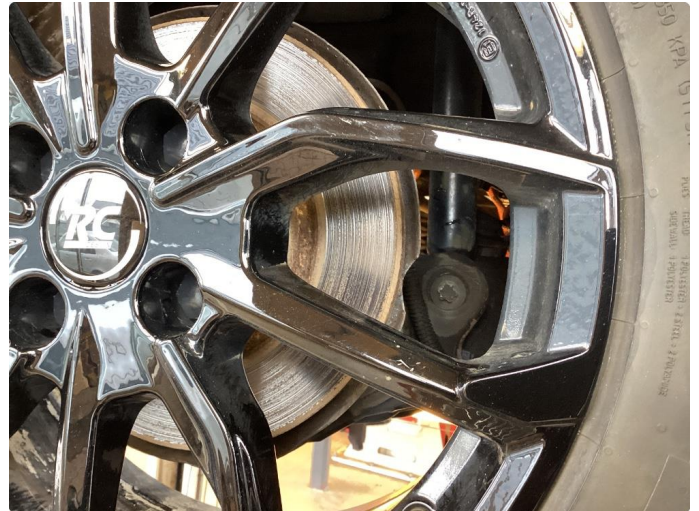
1.1 Riper på felg