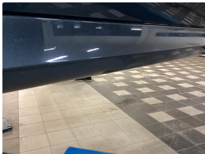
1.3 Lakk skade