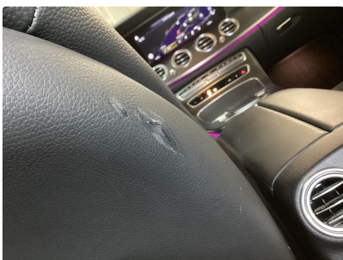
2.1 Merkepå sete rygg