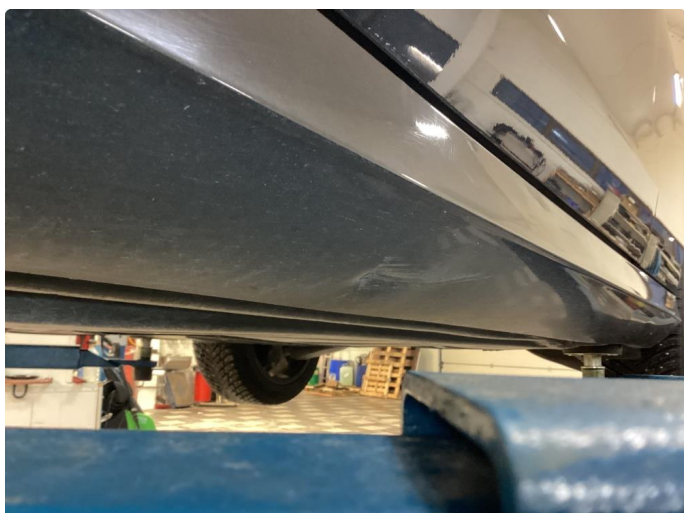
1.3 Lakk skade