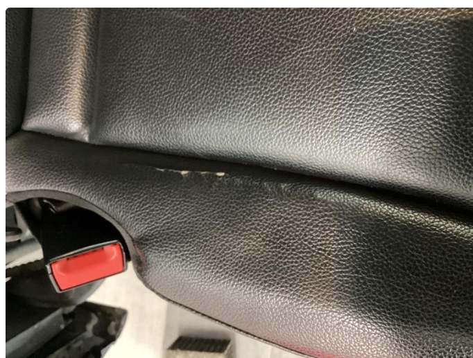
2.1 Skade på setetrekk