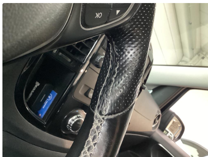
2.3 Noe slitasje