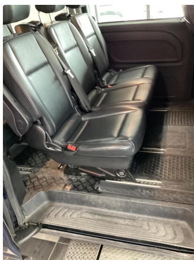
2.1 Skade på setetrekk