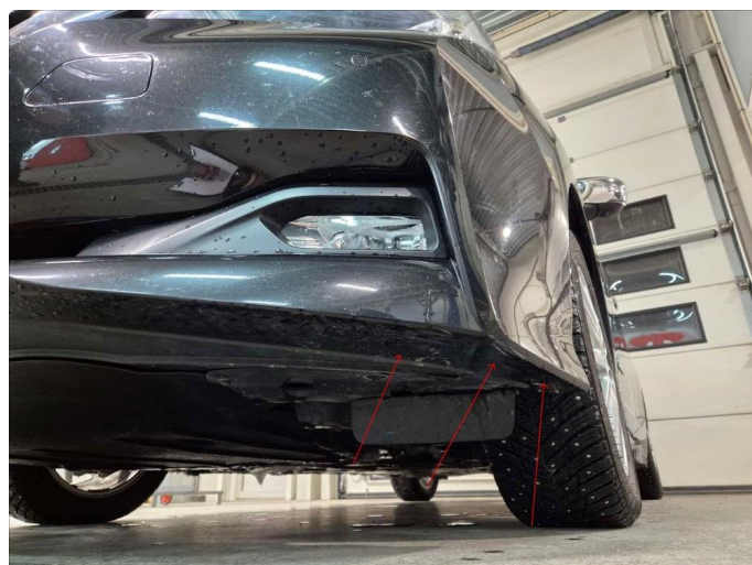
1.5 Riper nede/under støtfanger venstre foran