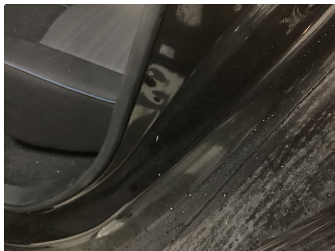
1.3 Bulk(er) med lakkskade