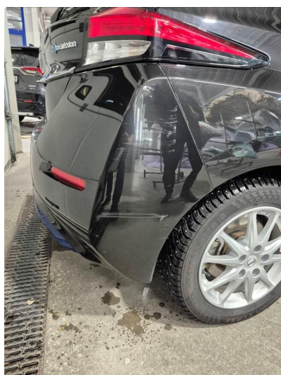
1.4 Riper på støtfanger hjørne høyre bak