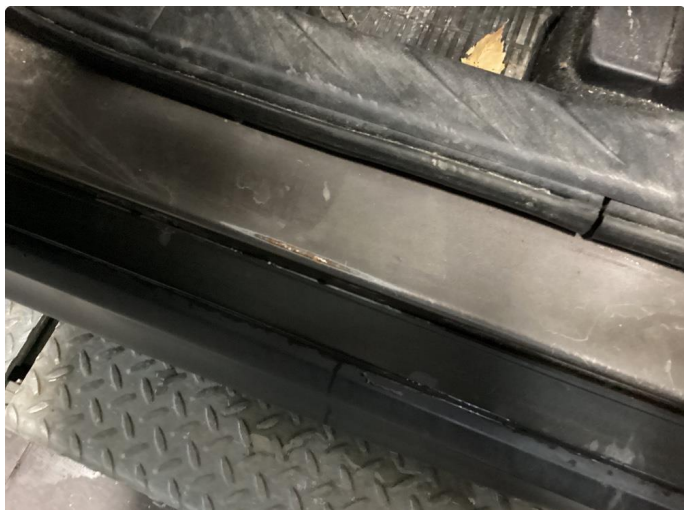
1.2 Slitt innsteg