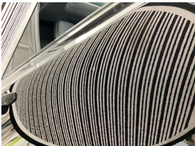
1.1 Parkerings bulk