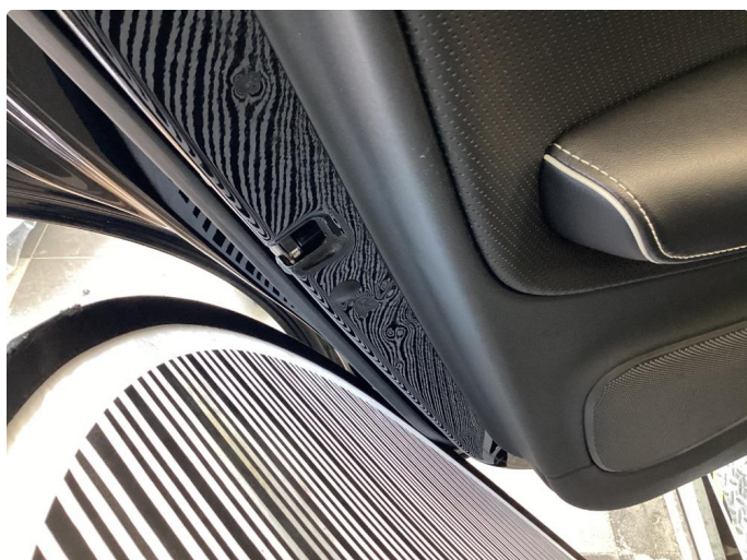
1.2 Noen riper og småbulker