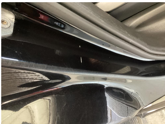
1.2 Noen riper og småbulker