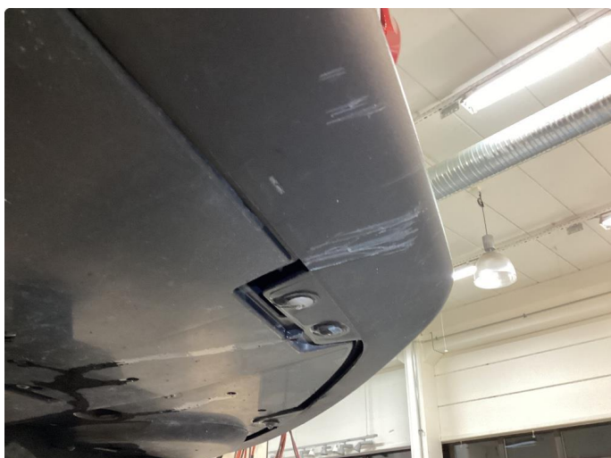
1.2 Subberiper i underkant foran