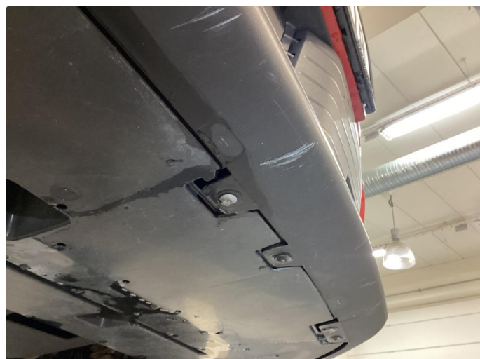
1.2 Subberiper i underkant foran