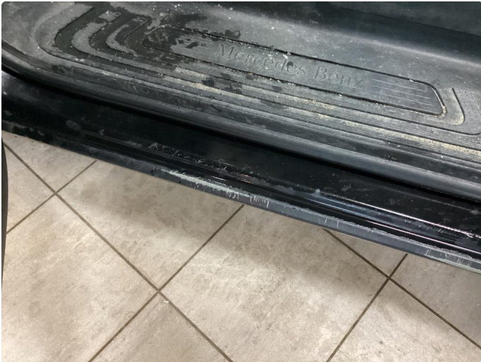
1.2 Slitt innsteg