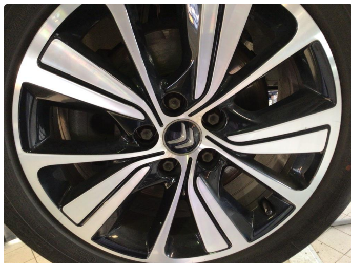
1.2 Noen bruksmerker på felger