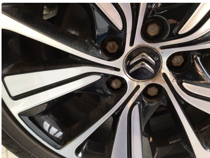
1.2 Noen bruksmerker på felger