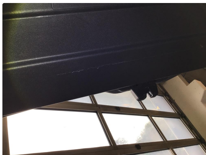
2.1 Skadet/merker etter utstyr