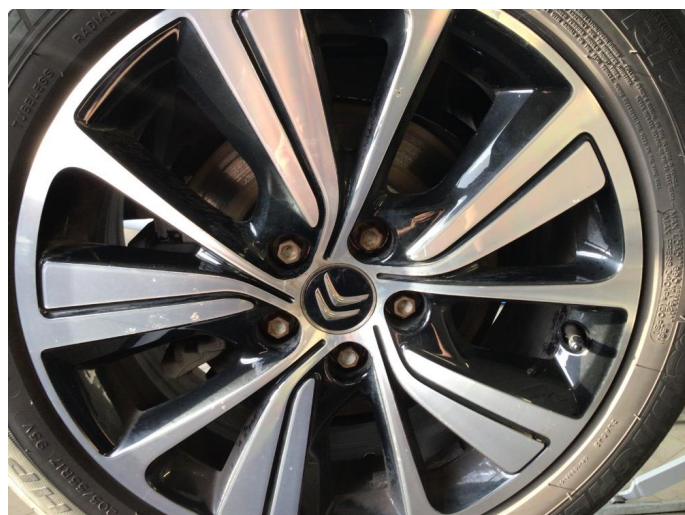
1.2 Noen bruksmerker på felger