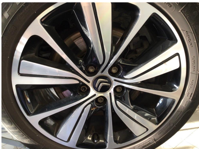
1.2 Noen bruksmerker på felger