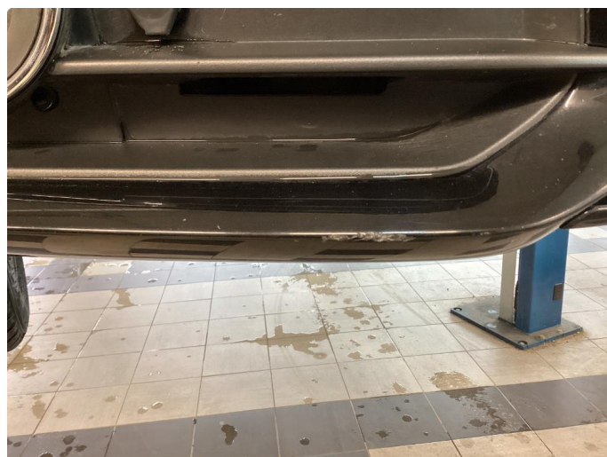
1.5 Skarpe kanter