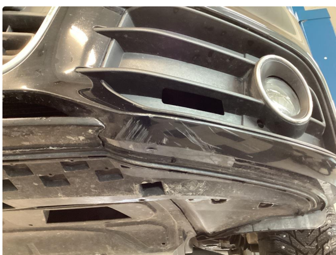
1.5 Skarpe kanter