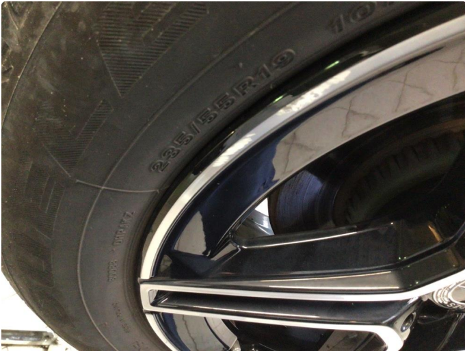
1.2 Bruksmerker på felger