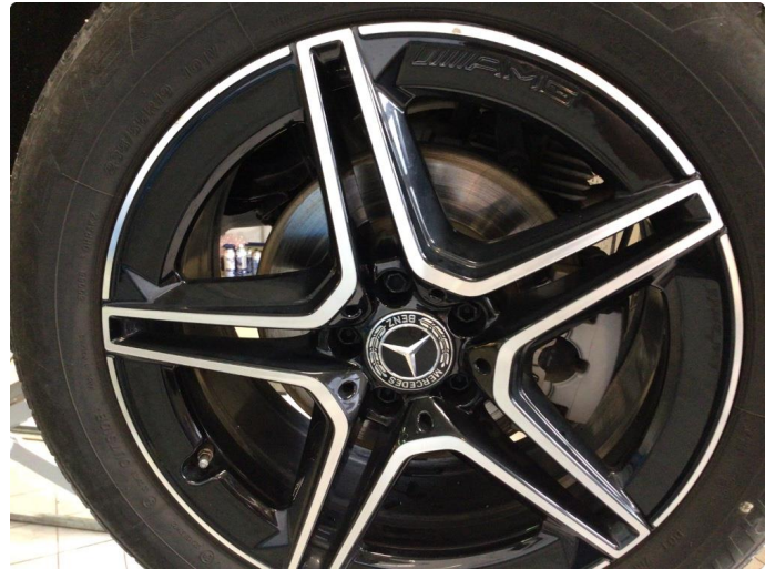
1.2 Bruksmerker på felger