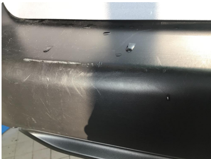
1.4 Bruksmerker bak fanger