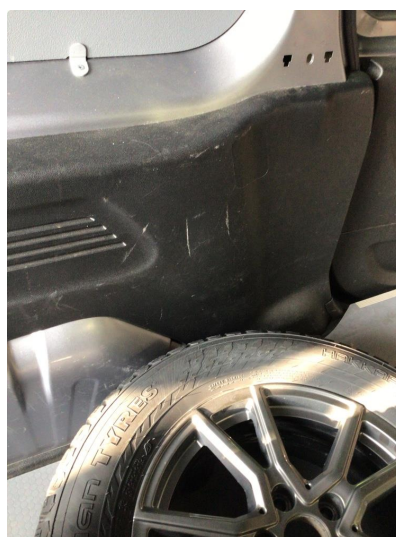
2.1 Generelt mye bulker/riper