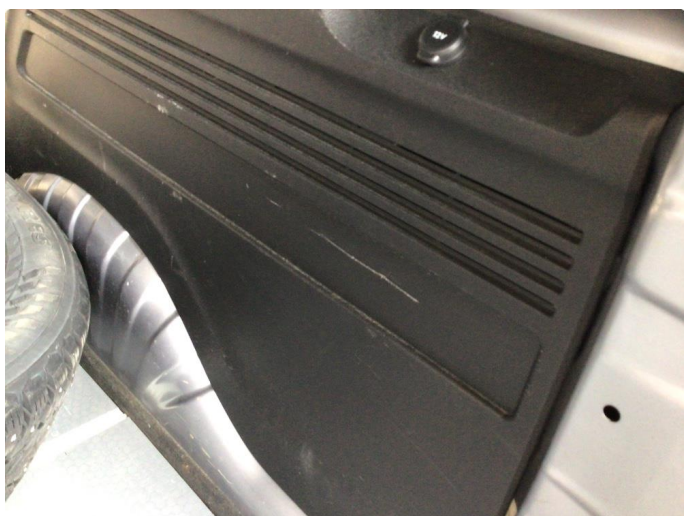
2.1 Generelt mye bulker/riper