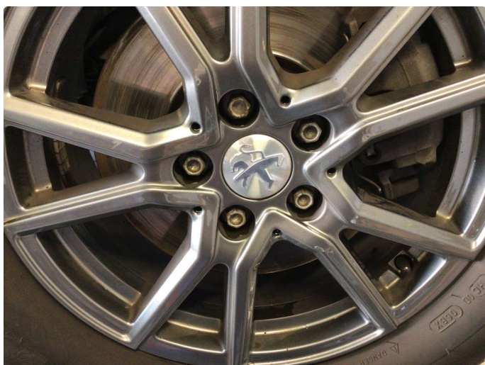
1.2 Merker på felger