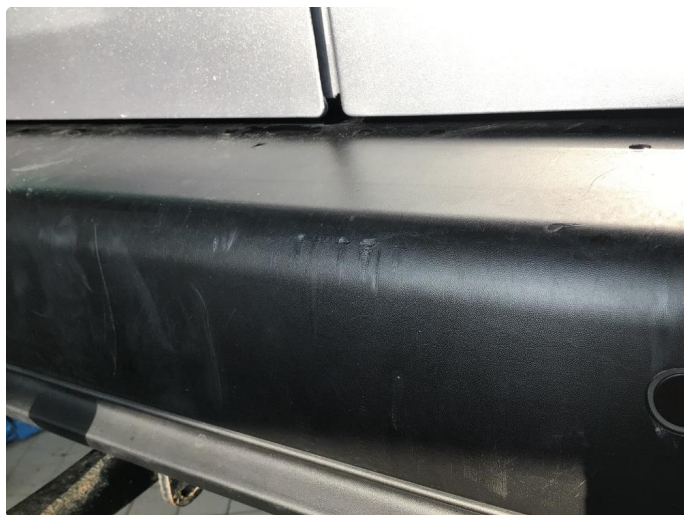
1.4 Bruksmerker bak fanger