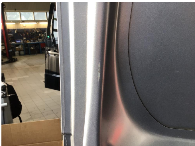
2.1 Generelt mye bulker/riper