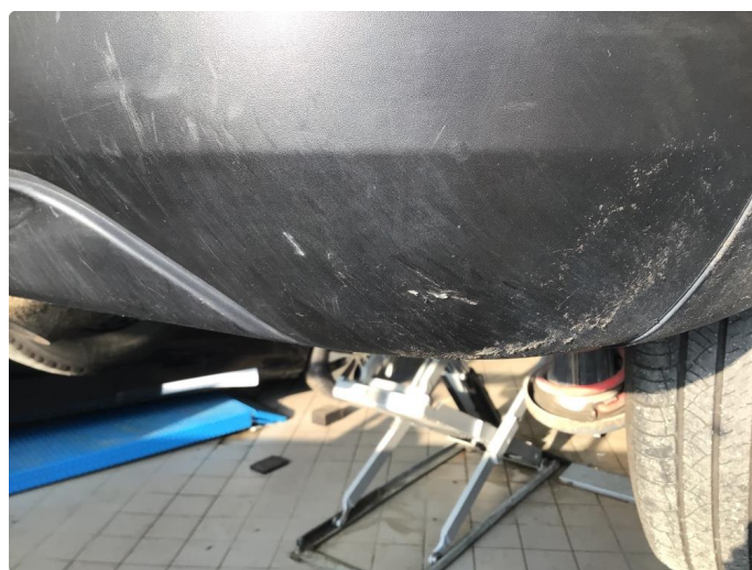
1.4 Bruksmerker bak fanger