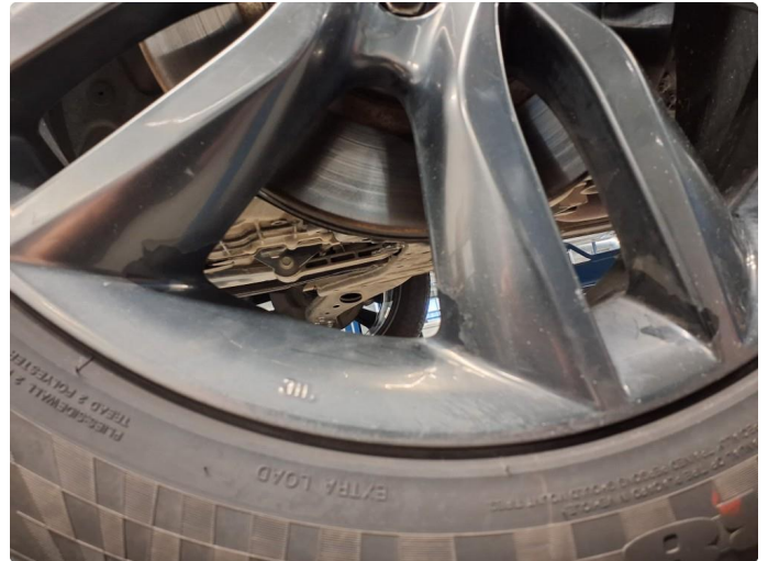
1.3 Skade på felg