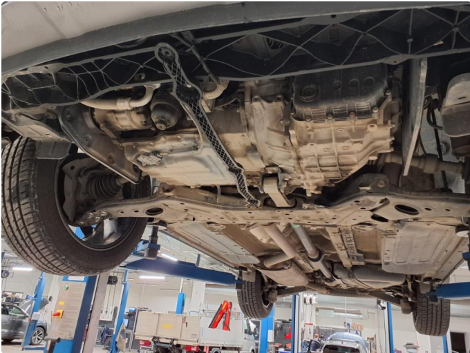
1.2 Beskyttelsesplate skadet/mangler