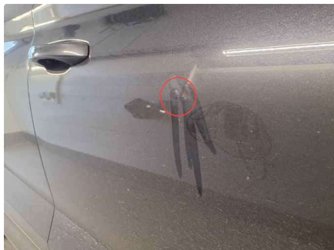
1.2 Bulk med lakkskade