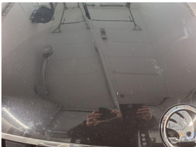
1.1 Mye stensprut