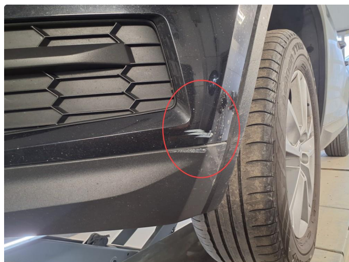
1.4 Ripe(r) ned til grunning