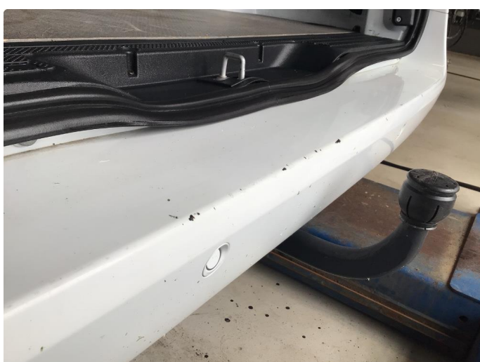
1.2 Slitt gjennom lakk