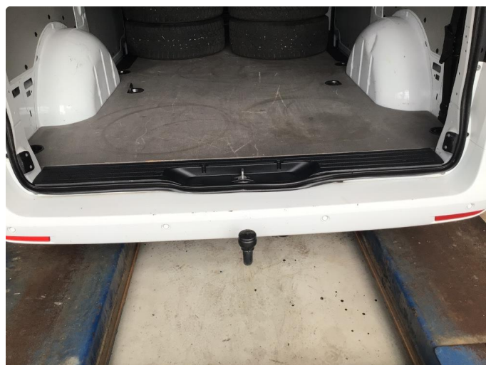
1.2 Slitt gjennom lakk