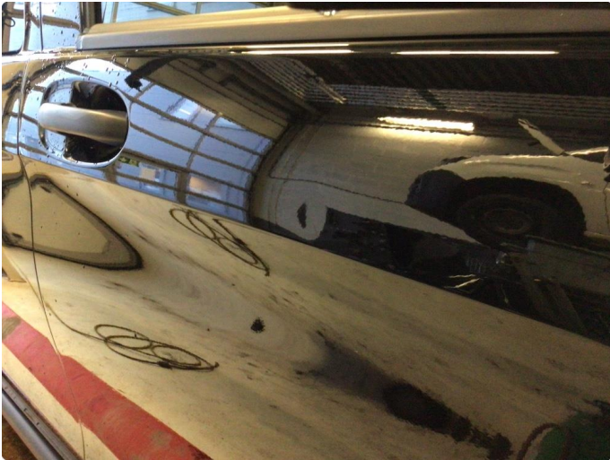
1.2 Smart Repair