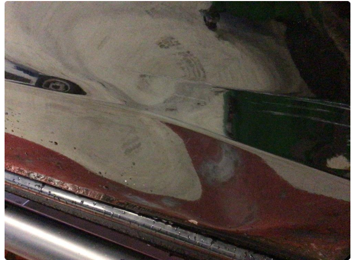
1.2 Smart Repair