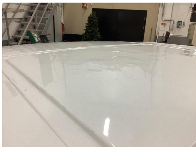
1.3 Bulk med lakkskade