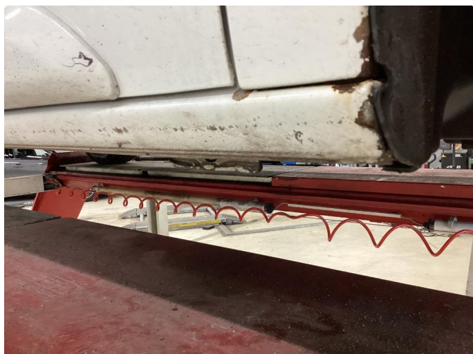
1.1 Noe korrosjon/rust