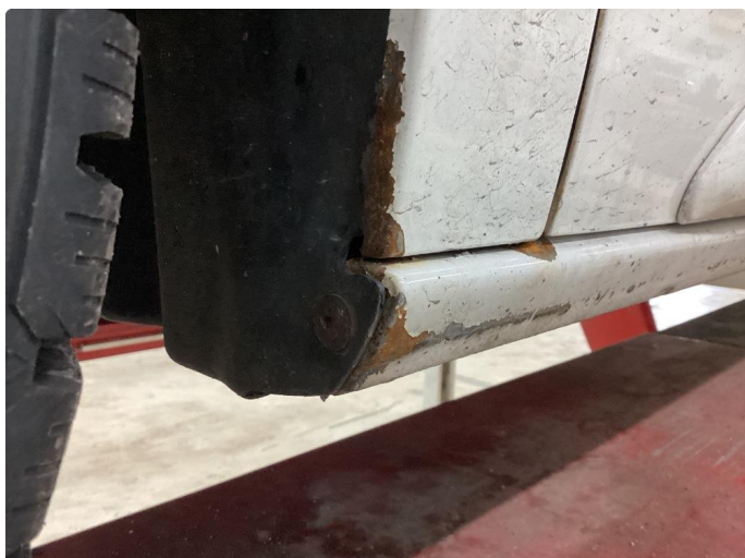
1.1 Noe korrosjon/rust