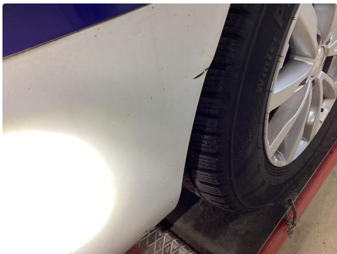
1.6 Bulk med lakkskade