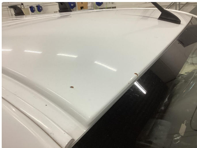
1.7 Steinsprut med rust