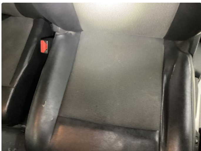
2.1 Skade på setetrekk