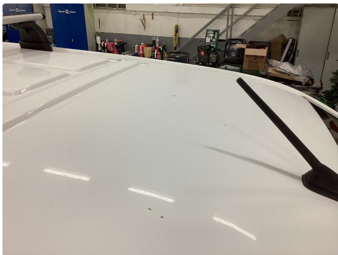
1.7 Steinsprut med rust