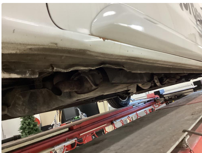
1.1 Noe korrosjon/rust