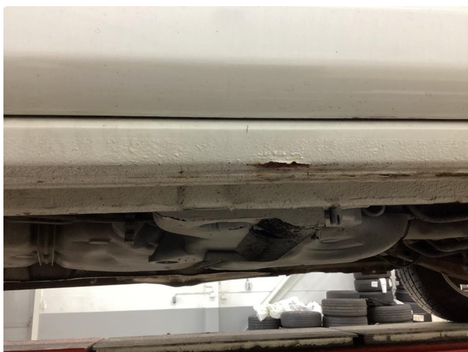
1.1 Noe korrosjon/rust