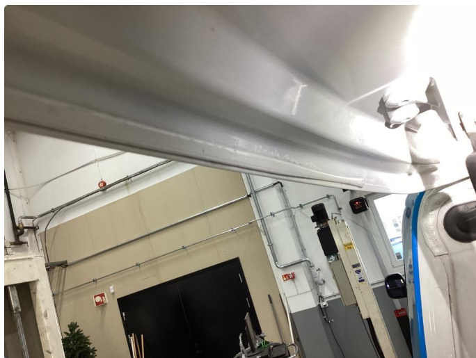
1.4 Rust i fals