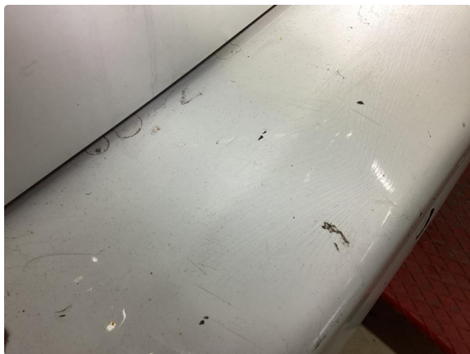
1.6 Bulk med lakkskade