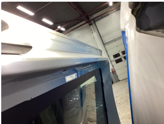
1.3 Rust i fals