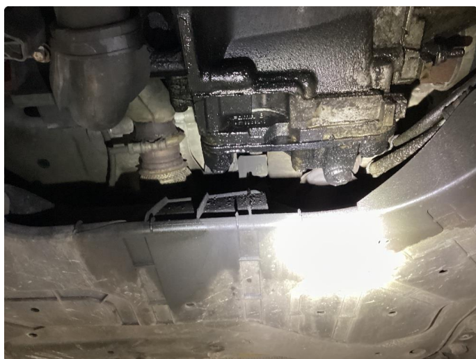
3.1 Øvrige feil