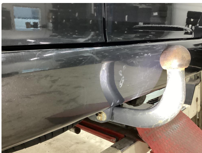
1.4 Bulk med lakkskade