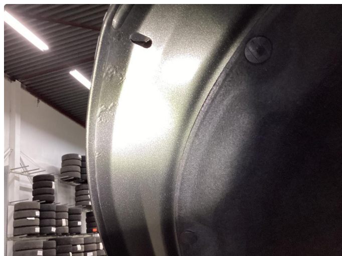
1.2 Rust i fals