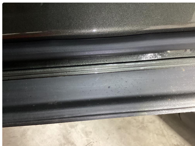
1.3 Rust i fals