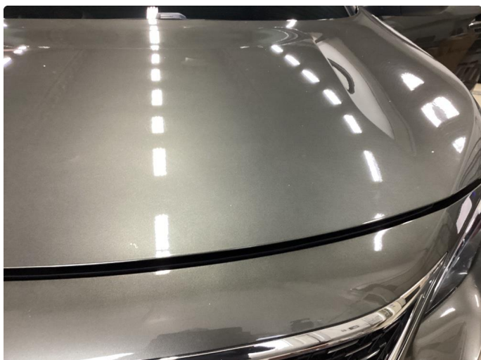
1.1 Mye stensprut