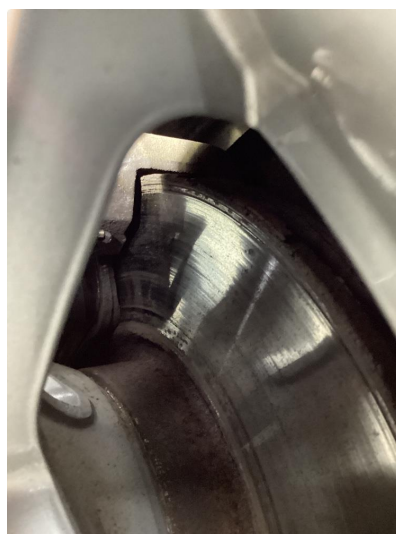
2.1 Slitte/stor slitekant