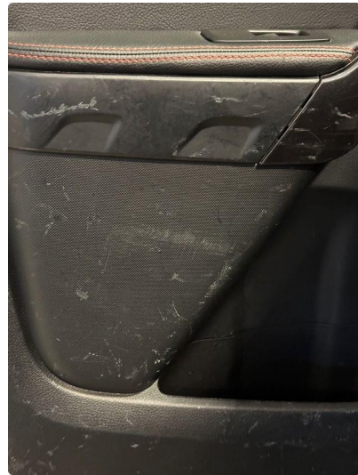
2.1 Noen riper/merker i dørtrekk venstre bak