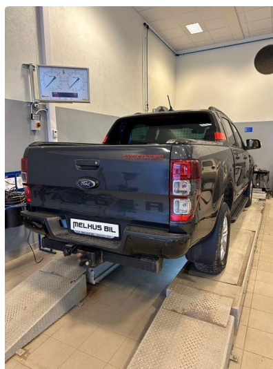
1.2 Noen riper/bulker i fanger bak