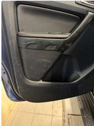
2.1 Noen riper/merker i dørtrekk venstre bak