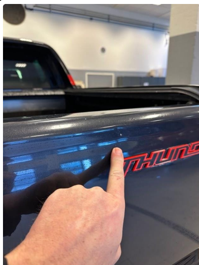
1.1 Noen bulker og lakkskade i bakluke. Lakkeres forenklet