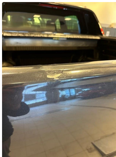
1.1 Noen bulker og lakkskade i bakluke. Lakkeres forenklet