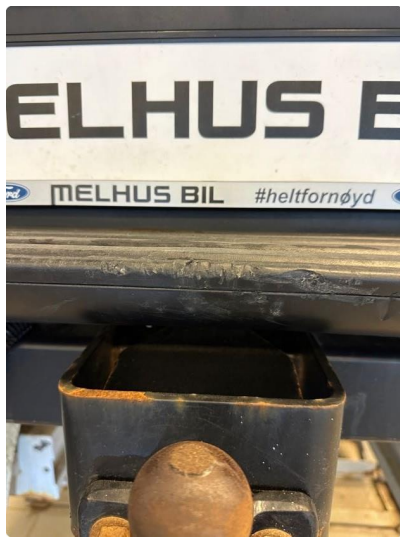
1.2 Noen riper/bulker i fanger bak