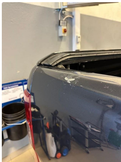
1.1 Noen bulker og lakkskade i bakluke. Lakkeres forenklet