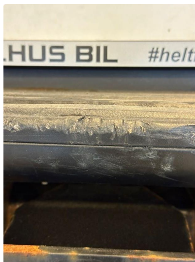
1.2 Noen riper/bulker i fanger bak