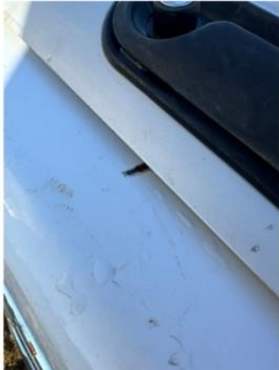
1.1 Lita ripe i bakluke. Lakkeres forenklet