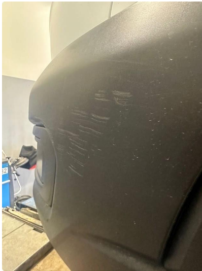
1.3 Noen ripe(r) på fanger venstre foran