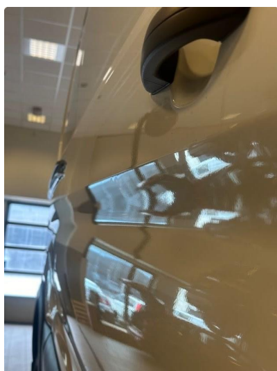
1.1 Flere små p-bulker på dør venstre bak