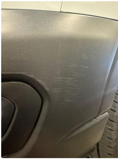
1.3 Noen ripe(r) på fanger venstre foran