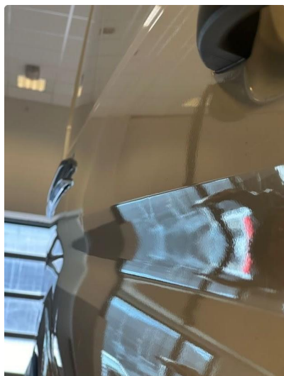
1.1 Flere små p-bulker på dør venstre bak