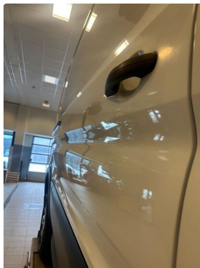
1.1 Flere små p-bulker på dør venstre bak