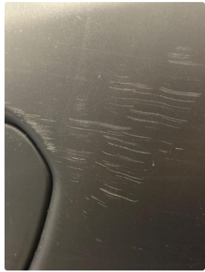
1.3 Noen ripe(r) på fanger venstre foran