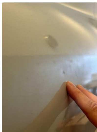
1.2 Flere små p-bulker på skjerm venstre bak