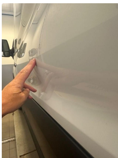
1.2 Flere små p-bulker på skjerm venstre bak