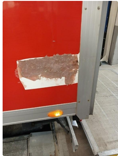
1.4 Riper på skap, merke på bakluke og side