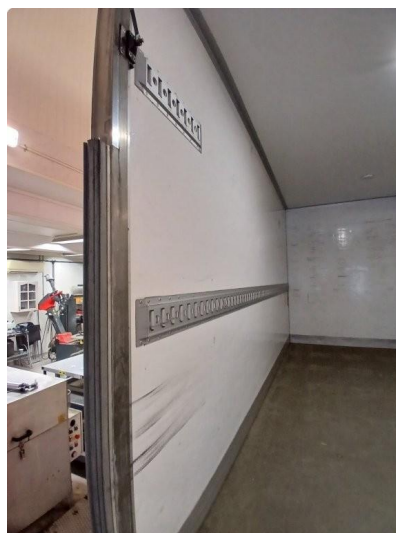
1.1 Bruksslitasje inside skap, oversiktsbilder