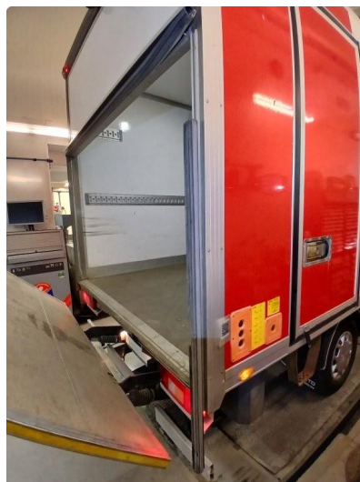
1.1 Bruksslitasje inside skap, oversiktsbilder