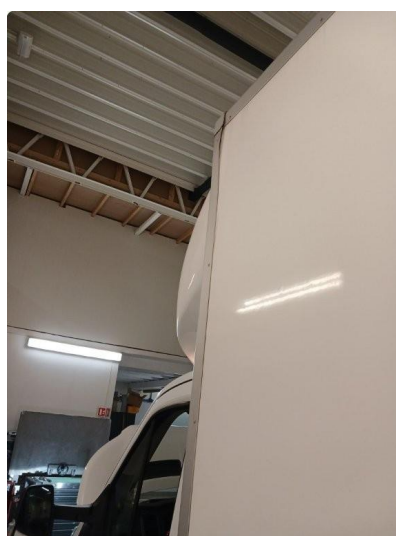
1.2 Bøyd list på venstre side foran