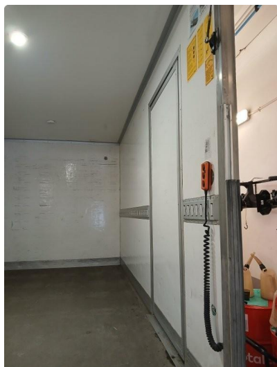
1.1 Bruksslitasje inside skap, oversiktsbilder