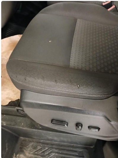
2.1 Noe slitasje på to av setene