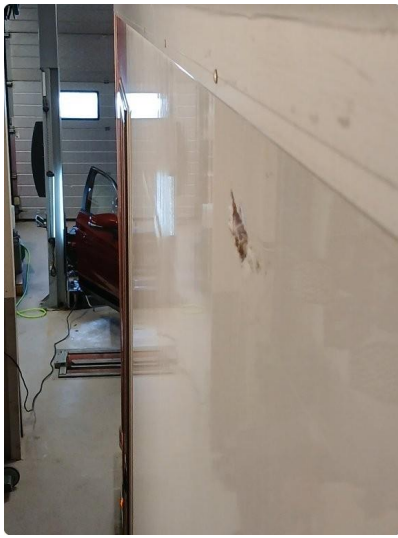
1.3 Skade oppe på venstre side