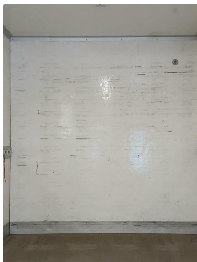
1.1 Bruksslitasje inside skap, oversiktsbilder