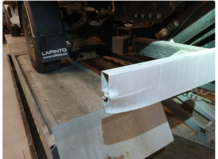
1.5 Merker på lister begge sider bak