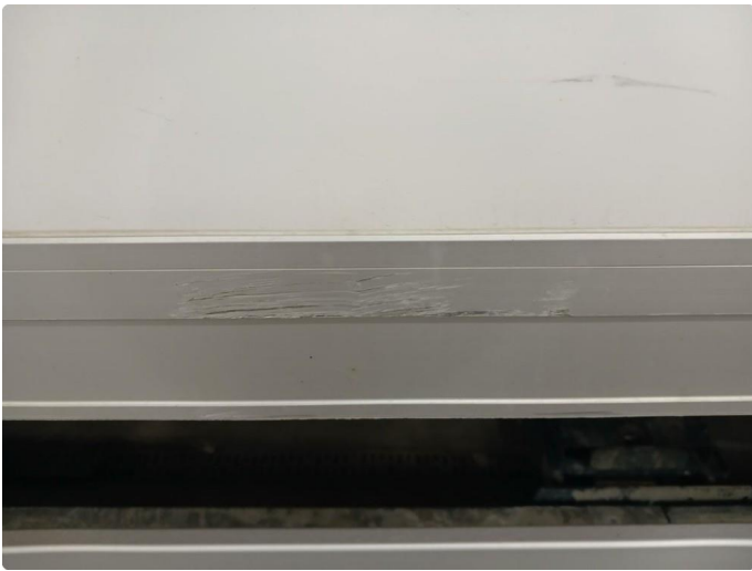
1.4 Riper på skap, merke på bakluke og side