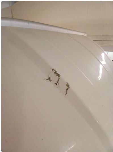
1.6 Flere rifter og riper på taket