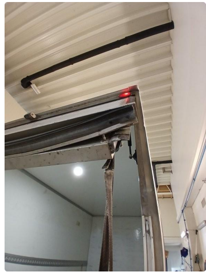
1.4 Riper på skap, merke på bakluke og side