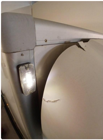
1.6 Flere rifter og riper på taket