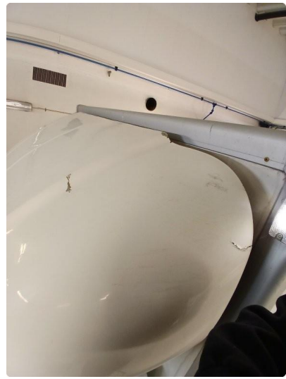
1.6 Flere rifter og riper på taket