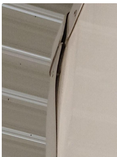
1.2 Bøyd list på venstre side foran