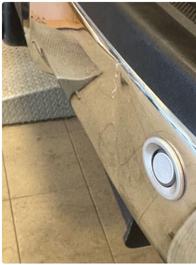
1.4 Lite skade i fanger høyre bak