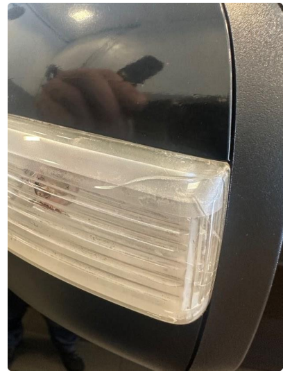
2.1 No krakelering i lys venstre side