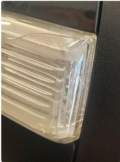
2.1 No krakelering i lys venstre side