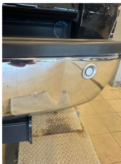
1.4 Lite skade i fanger høyre bak