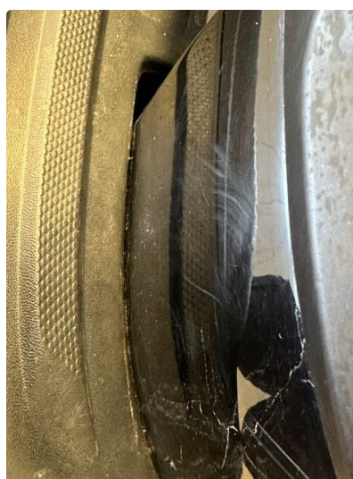
1.4 Lite skade i fanger høyre bak