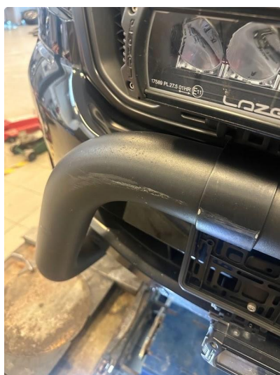
1.3 Lite skade i bøyle foran. Høyre side