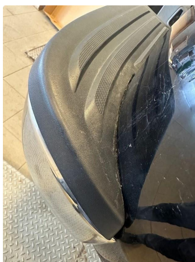
1.4 Lite skade i fanger høyre bak