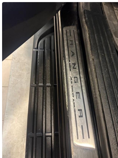
1.2 Noe slitt innsteg venstre foran