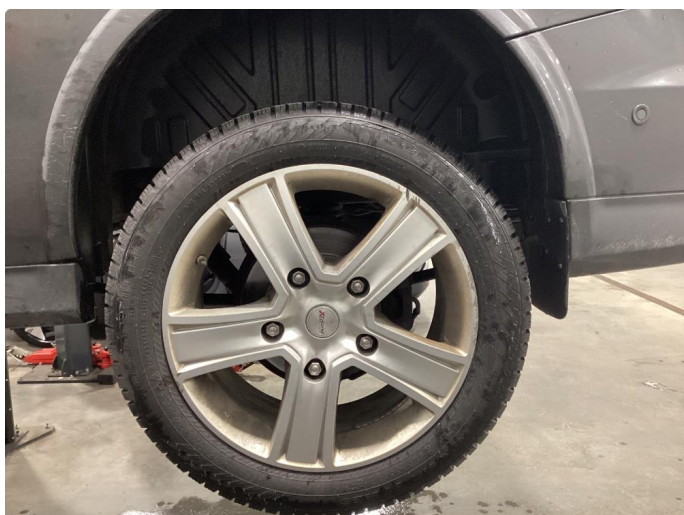
1.3 Kantkjørt felg