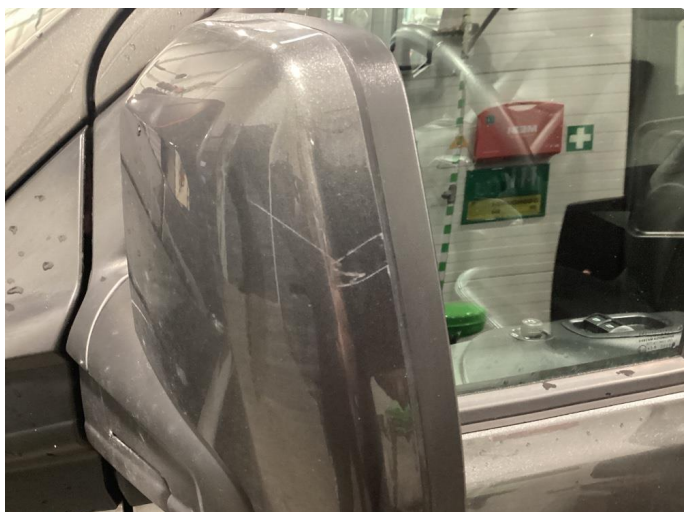
1.1 Speilhus riper