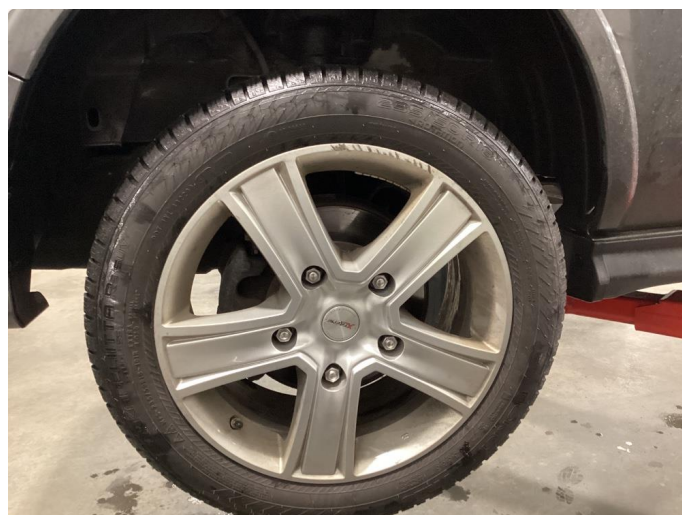
1.3 Kantkjørt felg