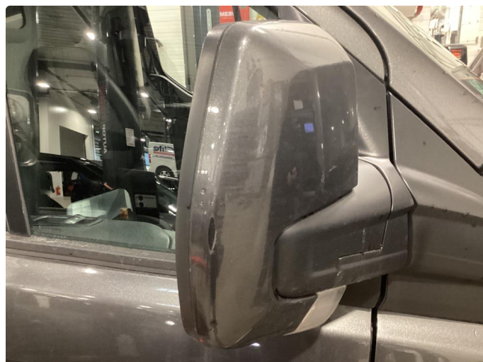
1.2 Speilhus riper