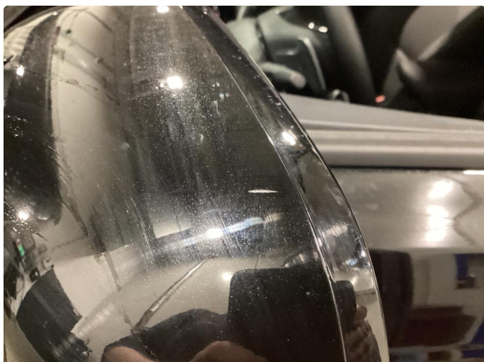
1.1 Speilhus riper