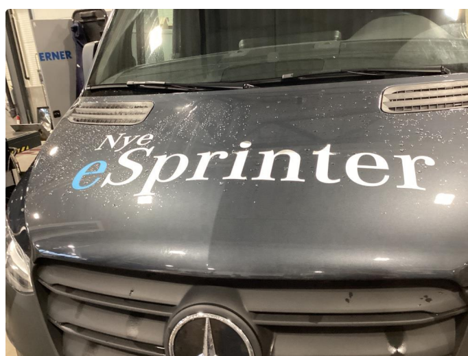
3.2 Fjerne dekor/logo