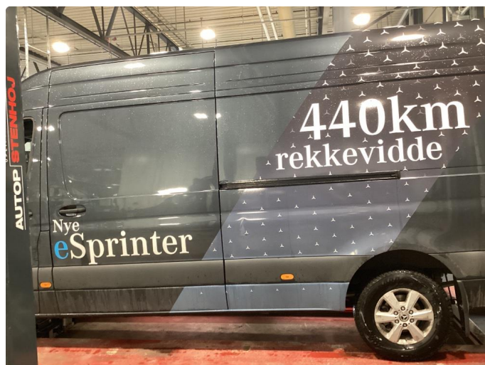
3.2 Fjerne dekor/logo