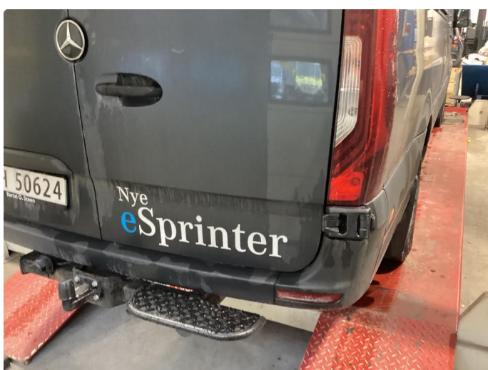
3.2 Fjerne dekor/logo