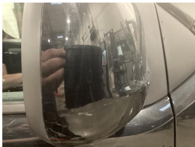
1.3 Speilhus riper