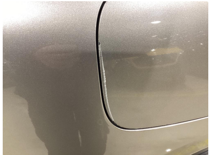
1.3 Slitt lakk