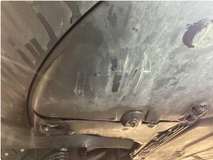
1.1 Skrubbskader underkant