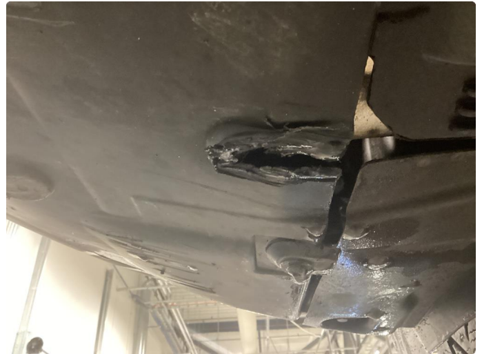
1.1 Skrubbskader underkant