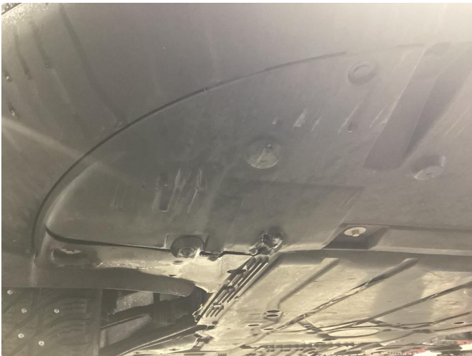
1.1 Skrubbskader underkant