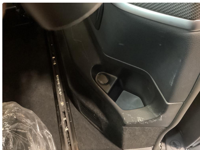
2.1 Skadet/merker etter utstyr