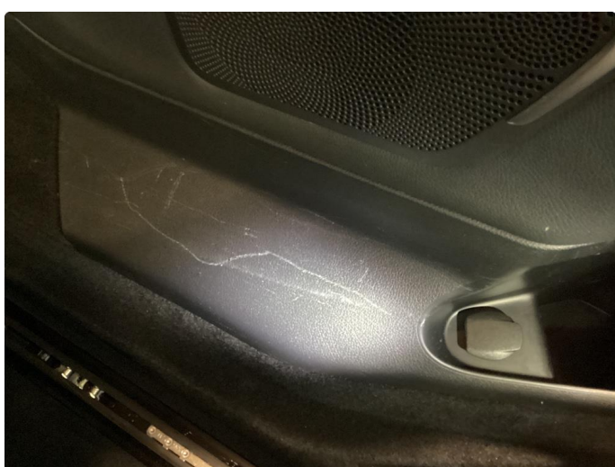
2.1 Skadet/merker etter utstyr