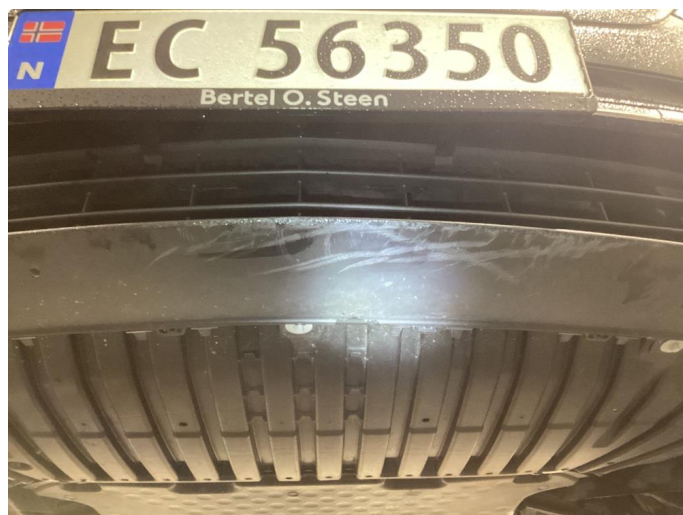
1.3 Skrubbskader underkant