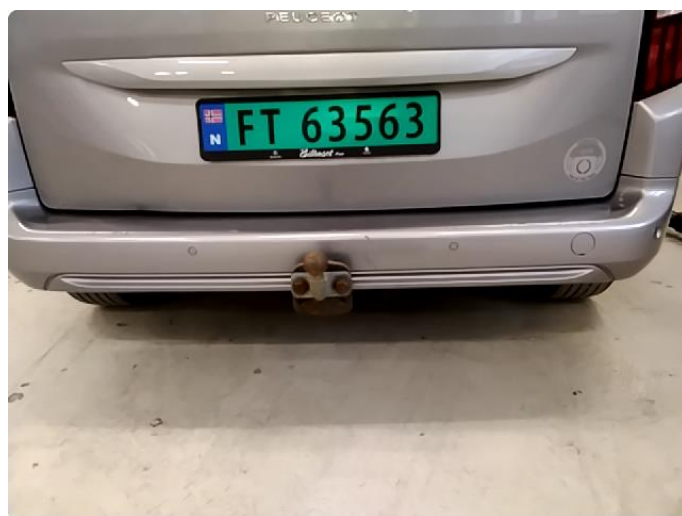
1.5 Ripe(r) ned til grunning