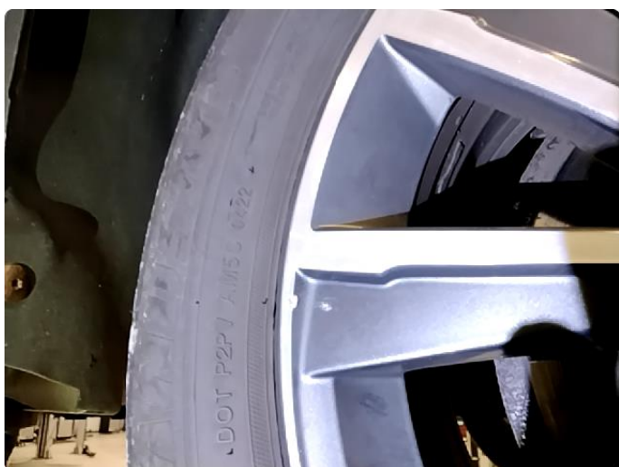
1.4 Skade på felg