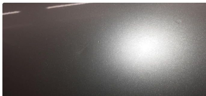
1.1 Noen steinsprang og riper i lakk