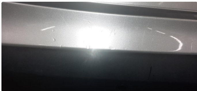
1.1 Noen steinsprang og riper i lakk