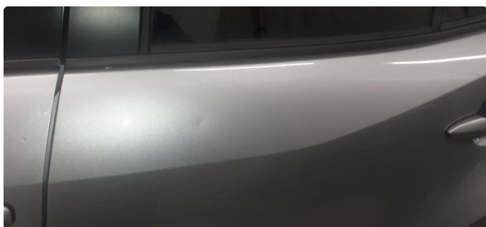
1.1 Noen steinsprang og riper i lakk