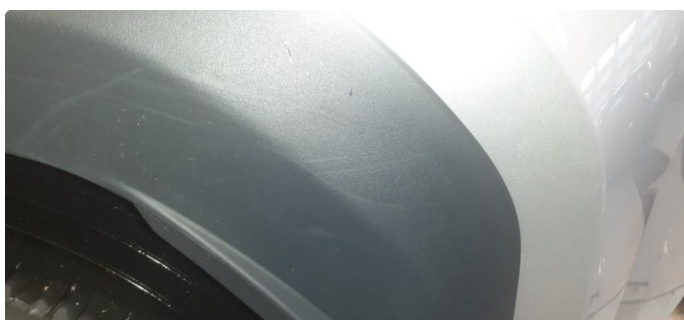
1.1 Noen steinsprang og riper i lakk