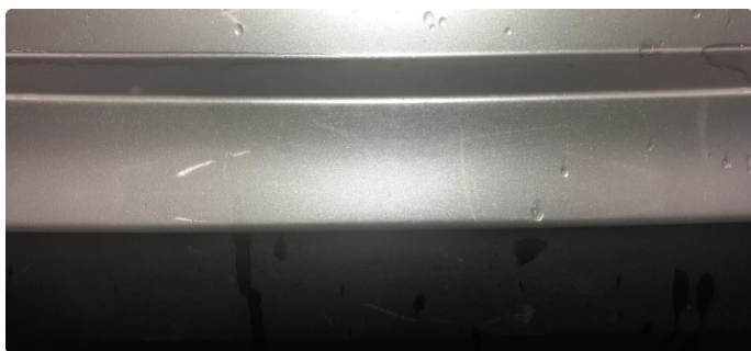
1.1 Noen steinsprang og riper i lakk