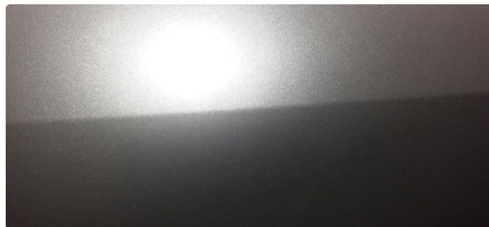
1.1 Noen steinsprang og riper i lakk