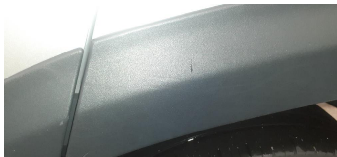
1.1 Noen steinsprang og riper i lakk