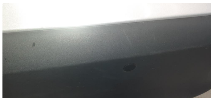
1.1 Noen steinsprang og riper i lakk