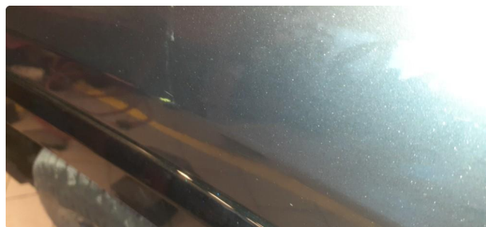
1.1 Noen steinsprang og riper i lakk, se bilder