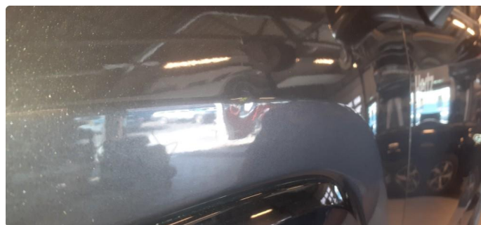
1.1 Noen steinsprang og riper i lakk, se bilder