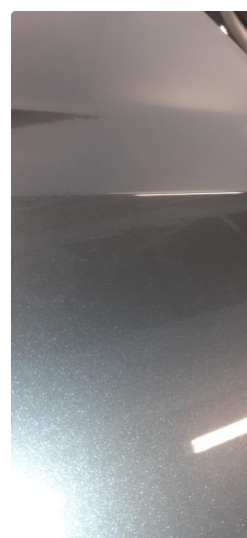
1.1 Noen steinsprang og riper i lakk, se bilder