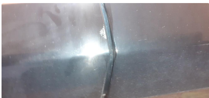
1.1 Noen steinsprang og riper i lakk, se bilder