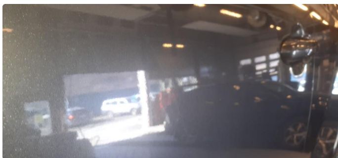
1.1 Noen steinsprang og riper i lakk, se bilder