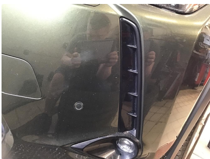
1.2 Noe steinsprut på støtfanger foran