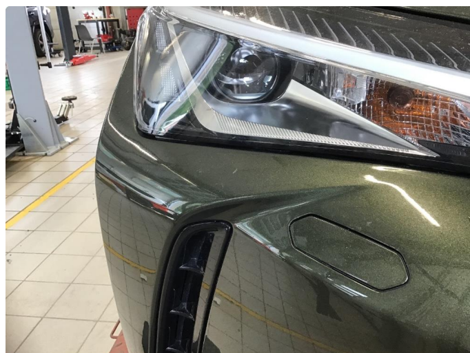
1.2 Noe steinsprut på støtfanger foran