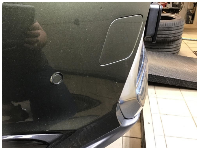
1.2 Noe steinsprut på støtfanger foran