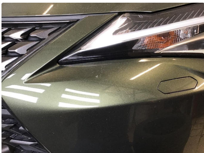
1.2 Noe steinsprut på støtfanger foran